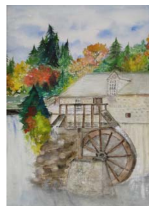
Moulin de Kings Landing Canada