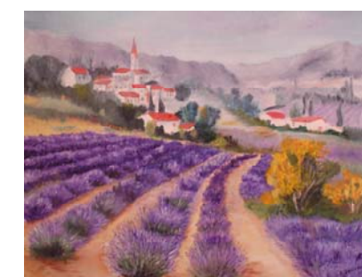
Cœur de Provence

23, rue de la Vendée 71320 TOULON / ARROUX 03 85 79 52 12