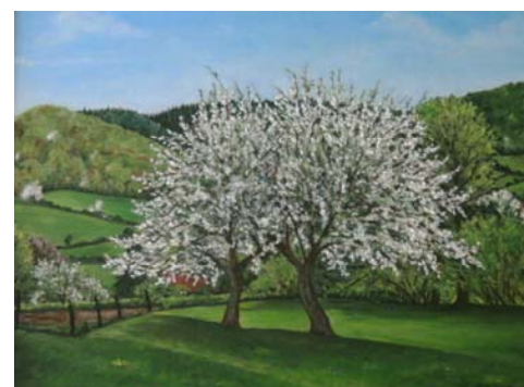
Printemps aux Grands Champs