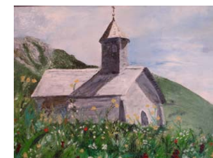
Chapelle au printemps

8, route d'Autun 71320 TOULON / ARROUX 03 85 79 47 51